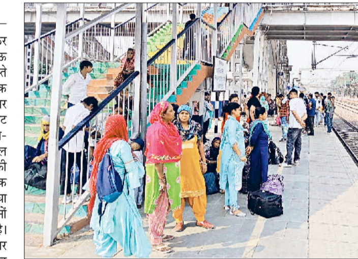
सोनीपत। स्टेशन पर ट्रेन का इंतजार करते यात्री।

लोग गर्मियों के मौसम में अक्सर छुट्टियां मनाने के लिए बाहर जाने का प्लान बनाते हैं, लेकिन कई बार लोगों को कंफर्म टिकट नहीं मिल पाती है। अब यात्रियों की सुविधा के लिए रेलवे की तरफ से दिल्ली-अंबाला रूट पर भी साप्ताहिक स्पेशल ट्रेन (05301/02) का परिचालन शुरू किया गया है। मऊ