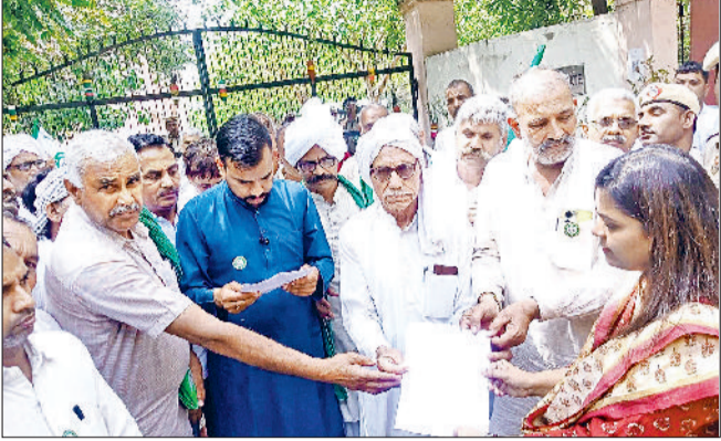
सोनीपत। गोहाना रोड पर रोष मार्च निकालते संयुक्त किसान मोर्चा के पदाधिकारी व किसान और लघु सचिवालय के गेट पर राष्ट्रपति के नाम उपायुक्त को ज्ञापन देते किसान नेता।