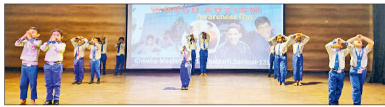
हरिभूमि न्यूज ॥ राई

विश्व ऑटिज्म जागरूकता दिवस के अवसर पर रेणु विद्या मंदिर के ऑटिडोरियम में भव्य एवं प्रेरणादायक कार्यक्रम का आयोजन किया गया। कार्यक्रम में दिव्यांग विद्यार्थियों ने उत्साहपूर्वक भाग लेते हुए अपनी अद्भुत प्रतिभा का प्रदर्शन किया और उपस्थित लोगों का मन मोह लिया। आयोजित सांस्कृतिक कार्यक्रमों में बच्चों ने नृत्य, गीत और अन्य प्रस्तुतियों के माध्यम से अपनी कला का प्रदर्शन किया। उनकी प्रस्तुतियों ने सभी को भाव-विभोर कर दिया और पूरे वातावरण को उत्साह एवं उल्लास से