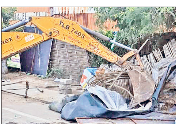
सोनीपत। टोल प्लाजा पर जेसीबी से अवैध निर्माण को तोड़ा गया।