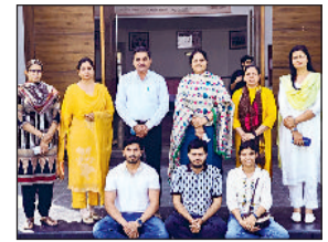
सोनीपत। मेरिट हासिल करने वाले छात्रों के साथ प्राचार्य एवं अन्य।