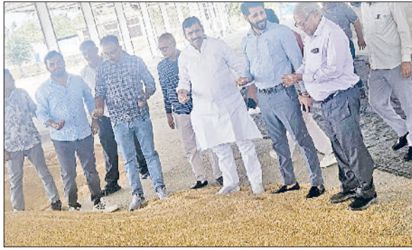
सोनीपत। खरीद शुरू कराते मार्केट कमिटी सचिव व वाइस चेयरमैन।

रोहतक रोड स्थित नई अनाज मंडी में वीरवार को गेहूं की आवक व खरीद का श्रीगणेश किया गया। पहले दिन मंडी में करीब 300 विंटल गेहूं की आवक हुई। नमी की मात्रा 12 प्रतिशत होने तक गेहूं की खरीद की गई। हरियाणा वेयरहाउस कार्पोरेशन (एचडब्ल्यूसी) की ओर से तीन किसानों से 210 विंटल गेहूं खरीदा गया। वहीं सरसों की खरीद न्यूनतम समर्थन मूल्य (एमएसपी) से ज्यादा