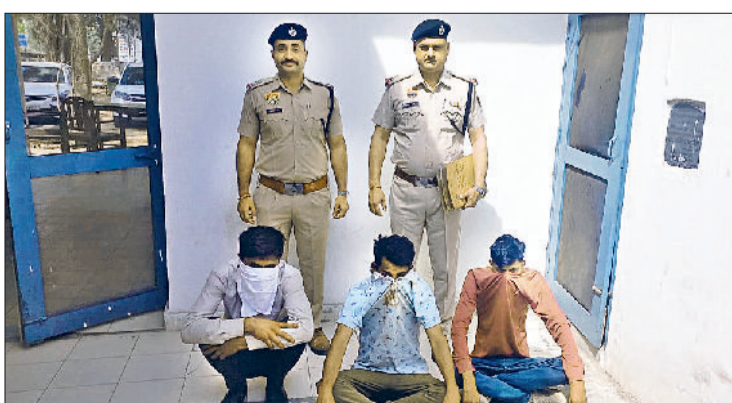
सोनीपत। पुलिस की गिरफ्त में साइबर ठग।

स्टॉक मार्केट में निवेश का झांसा देकर दस लाख की ठगी के आरोप में राजस्थान से तीन गिरफ्तार